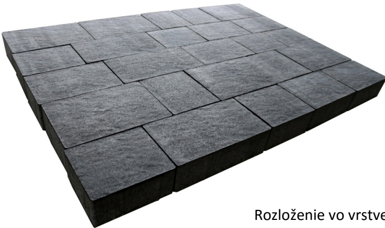
Rozloženie vo vrstve